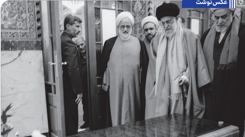
حضور حضرت آیت الله خامنه ای بر مزار شهید آیت الله صدوقی - ۱۳۸۶/۱۰/۱۲

پدرها و مادرها نسبت به مقدمات غیر لازم ازدواج سخت گیری نکنند؛ جوانها که سخت گیری ای ندارند، بگذارند ازدواج، اسلامی انجام بگیرد؛ بگذارند ازدواج برای دختر مسلمان و زن جوانی که در محیط اسلامی است، مثل ازدواج فاطمه ی زهرا باشد. ازدواجی با پیوند عشقی معنوی و الهی، و جوششی بی نظیر میان زن و مرد مؤمن و مسلمان، و همکاری و همسری به معنای واقعی بین دو عنصر الهی و شریف، اما بیگانه ای از همه ی تشریفات و زور و زیورهای پوچ بی محتوای ظاهری؛ و تربیت فرزند؛ و اداره ی محیط خانه؛ و البته اندیشیدن و پرداختن به همه چیز جامعه و دین و دانش و فعالیت اجتماعی و سیاسی؛ این است ازدواج درست زن مسلمان؛ اسلام این است. ● ۱۳۶۸/۱۰/۲۶ | اول ذی الحجه، سالروز ازدواج حضرت امیرالمؤمنین علیه السلام و حضرت زهرا علیه السلام مبارک باد