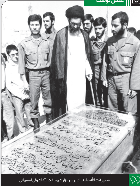
حضور آیت الله خامنه ای بر سر مزار شهید آیت الله اشرفی اصفهانی