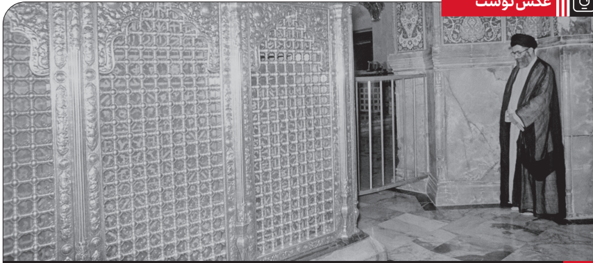
تصویری از حضرت آیت الله خامنه‌ای در کنار مضع مطهر حضرت معصومه