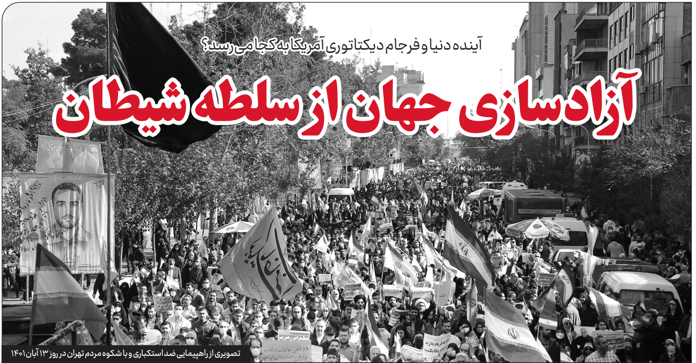
تصویری از راهپیمایی ضد استکباری و با شکوه مردم تهران در روز ۱۳ آبان ۱۴۰۱